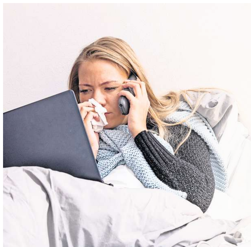
Per Telefon oder E-Mail: Beide Möglichkeiten sind für die Krankmeldung legitim.